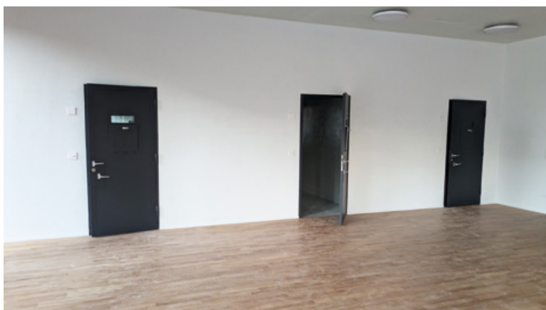
Cellule di addestramento

in modo da poter simulare fedelmente situazioni reali e offrono la possibilità sia di riprendere le esercitazioni sia di trasmetterle in diretta nelle aule. Ciò permetterà ai docenti di fornire valutazioni precise e immediate, analizzare i comportamenti in classe e rafforzare il legame tra la teoria e la pratica.